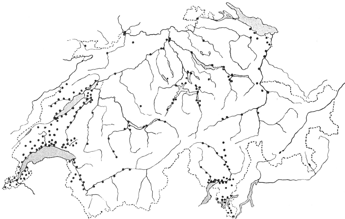
Abb. 1. Fundorte von Anopheles maculipennis und Anopheles bifurcatus in der Schweiz. (Zusammengestellt von H. Gaschen)

expérience, que j'avais projetée pour l'été passé, n'a pas pu être faite, pour des causes indépendantes de ma volonté, mais j'espère pouvoir la faire en Italie l'année prochaine.»