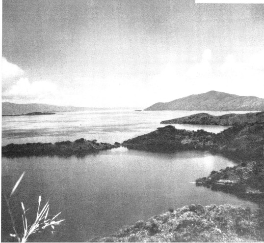
Mitten im Vulkangebiet des Kivus Im Vordergrund die typische Lavavegetation.