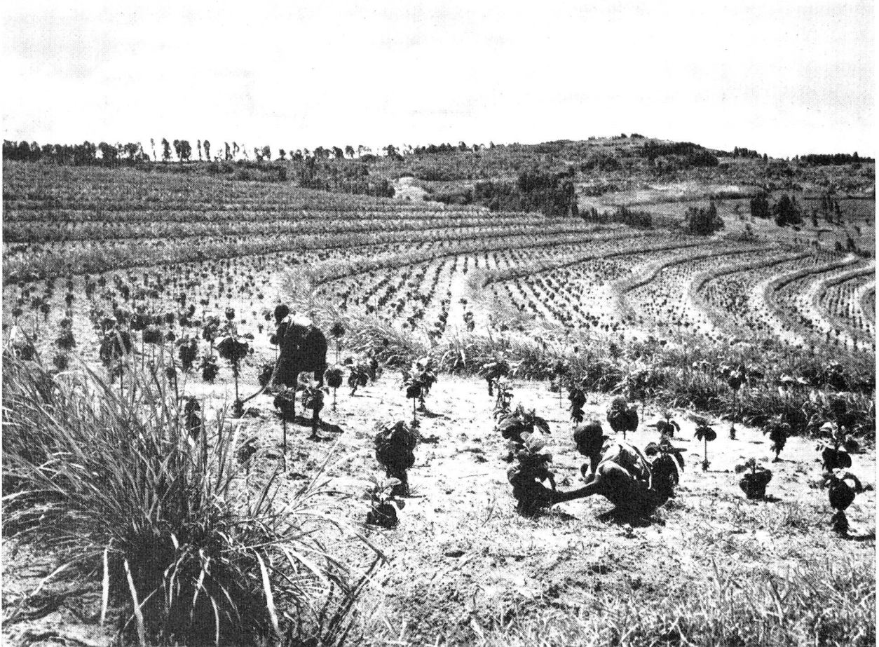
Dieses Bild zeigt eine solche terrassenförmige Anpflanzung von Cinchonem aus der Nähe.

Der Erdboden, der dazu bestimmt ist, die jungen Cinchonem aufzunehmen, wird tief gepflügt, oft wird noch Erde aufgeschüttet, oder er wird sonstwie besonders sorgfältig bearbeitet, um den in den