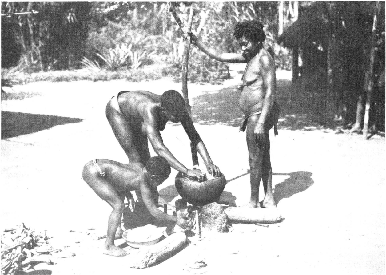
In einem Negerdorf im Ubangiegebiet, Belgisch Kongo. Grossmutter, Mutter und Tochter bei der Zubereitung einer Mahlzeit.

Unten: Photo Congopresse: Van den Heuvel.