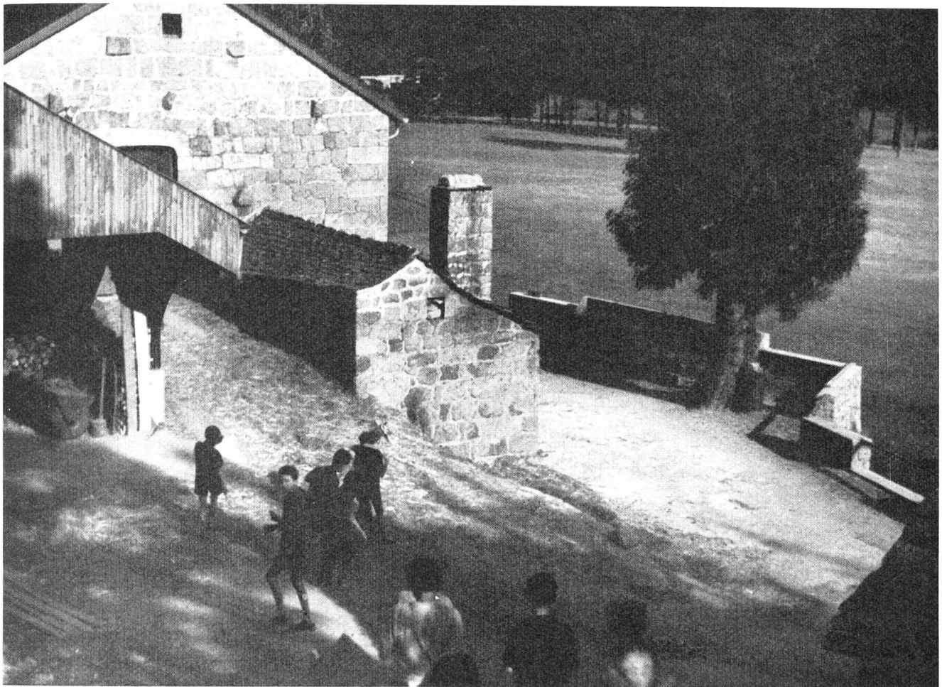
Wie eine Burg wächst die «Ferme Les Chatoux» aus einem sonnigen Hang und überblickt eine weite Ebene, den herrlichen Spielplatz, der von drei Seiten vom Lignon umflossen wird.

im Mittelpunkt eines grossen Dreiecks, das aus den drei folgenden Städten gebildet ist: der grauen Industriestadt St-Etienne, dem sauberen Handelsort im Rhonetal Valence und der heiligen Stadt Le Puy, dem wohlbekannten katholischen Wallfahrtsort an der Loire, dessen vulkanische Zuckerstockhügel, auf denen Kirchen und kolossale Madonnenfiguren stehen, dem Stadtbild Weltruhm verliehen haben.