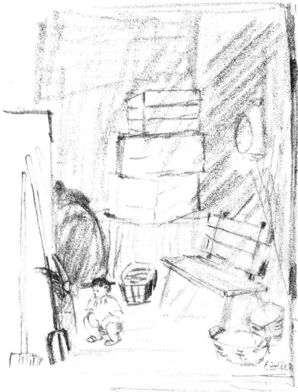
Zeichnungen E. Zoller.

gehorschen würde, der ihn an diese Stelle bannte, wer weiss warum. Deshalb begann sie noch ein wenig herumzustehen, aufzuräumen. Man musste ihm Zeit lassen. Wie er bebte und staunte, der fremde, aus dem nüchternen Blut ihrer Tochter hervorgegangene Spross! Hilfreich, feuchten Auges, breitete die alte Frau die Arme aus und tat als ob sie fliege.