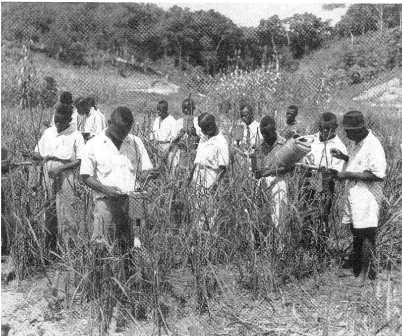
An Reisversuchspflanzen wird die künstliche Befruchtung zur Qualitätsverbesserung vorgenommen.