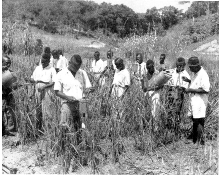
An Reisersuchspflanzen wird die künstliche Befruchtung zur Qualitätsverbesserung vorgenommen.