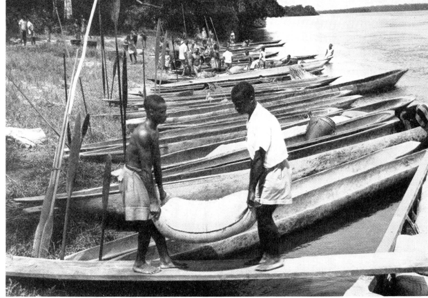
Auf einer Uferlichtung wird ein Reismarkt abgehalten.

Die landwirtschaftliche Versuchsanstalt von Belgisch Kongo, die Ineac, hat in Yangambi, in der Nähe von Stanleyville, am Ufer des Kongoflusses verschiedene Versuchspflanzungen angelegt, um jene Arten von Nutzpflanzen heranzuzüchten, die in diesen äquatorialen Gebieten den besten Ertrag versprechen. So hat die Ineac dort auch bewässerte Reisfelder erstellt, wo Zuchtungsversuche in folgender Weise vorgenommen werden: Die schwarzen Angestellten der Anstalt nehmen die künstliche Befruchtung des Reises vor, indem sie den weiblichen Griffel einer jeden Pflanze in ein Wasserbad von 43—44 Grad Wärme tauchen, um die männlichen Keimstoffe, die sich auf natürliche Weise eingehaust haben können, zu vernichten, ohne die Fortpflanzungsfähigkeit der Pflanze zu gefährden. Dieser Eingriff erlaubt die darauffolgende Befruchtung der Pflanze mit Keimstoffen einer bestimmten Reissart zur Züchtung einer besseren Qualität.