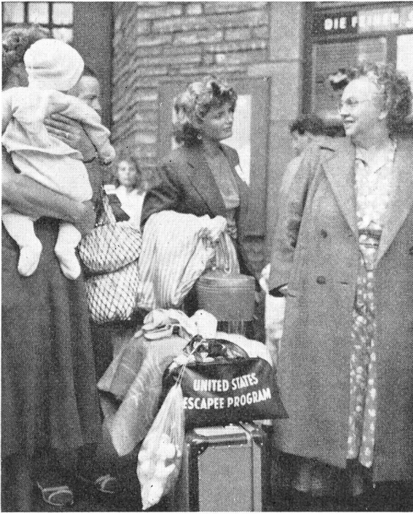
Am 4. September sind 150 ungarische Flüchtlinge mit einem Transport des Schweizerischen Roten Kreuzes in unser Land eingereist. Die Flüchtlinge stammen aus österreichischen Lagern, die so schnell als möglich aufgehoben werden sollen.