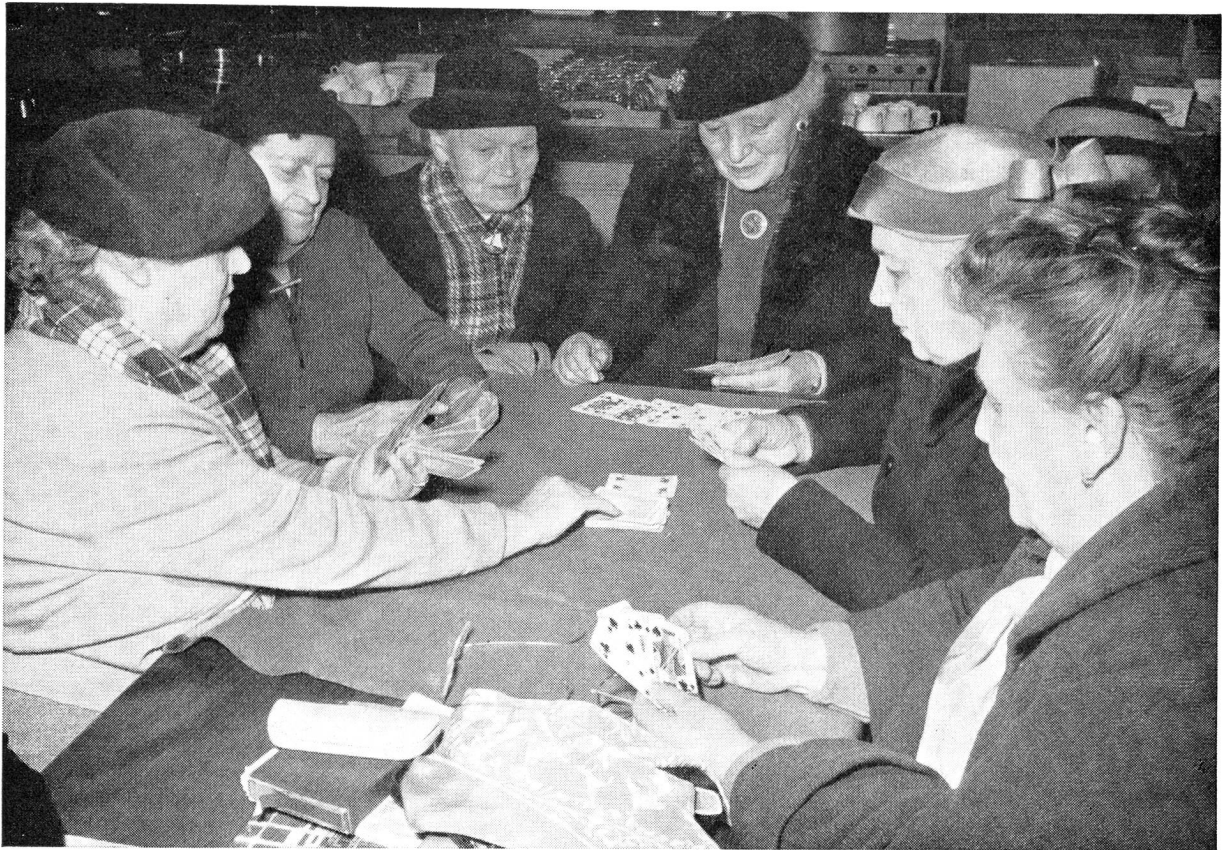
Die Sektion Genf des Schweizerischen Roten Kreuzes hat den Klub für Betagte «Le Rayon de Soleil» gegründet, der vom Herbstbeginn bis Ende des Frühjahrs jeden Mittwochnachmittag in einem Lokal der Schule «Eaux-Vives» siebzig alleinstehende Betagte zu geselligem Beieinandersein, zu Spiel, Unterhaltung und einer Teepause vereinigt. Gebrechliche werden von Rotkreuzhelferinnen, die über ein Auto verfügen, abgeholt und wieder heimgeführt. Die Schaffung eines zweiten Klubs ist vorgesehen.