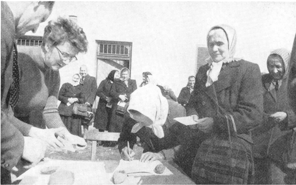
Betagte Flüchtlinge aus Radkersburg und Umgebung unterzeichnen eine Quittung für ein Rotkreuz-Patenchaftspaket aus der Schweiz.