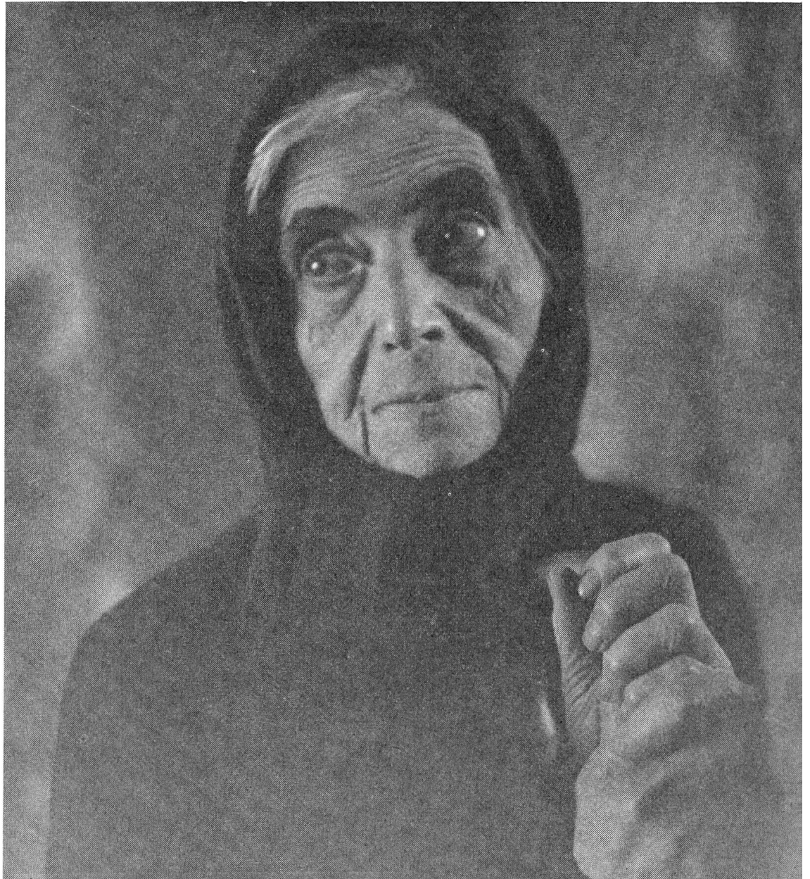
Bild links Gänzlich verloren und von Heimweh geplagt zieht sich die alte Vertriebene auf das einzige Fleckchen Lebensraum zurück, das man ihr zugewiesen hat: auf ein Bett.

Alles verloren: Heimat, Familie, Haus und Hof, Hab und Gut. Aus dem warmen Kreis der Familie jäh herausgerissen, in fremdem Land, in fremder Umgebung, vereinsamt und ohne Hoffnung sieht die Greisin dem erlösenden Tod entgegen. Bild rechts