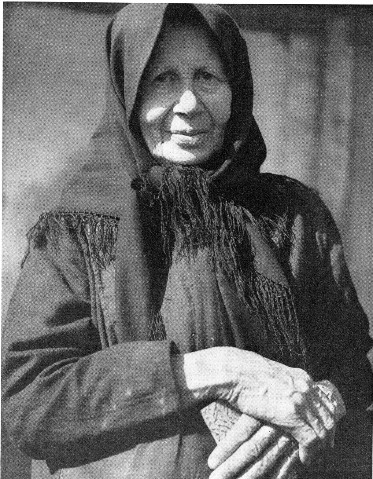
Alte volksdeutsche Flüchtlingsfrau, die im Gastland als Feldarbeiterin wieder ganz von vorne beginnen musste. In der Heimat war sie einem grossen eigenen Hofe vorgestanden.