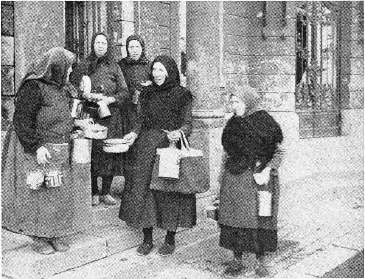
Auf der monatelangen Reise, um von drüben der Mur nach hüben der Mur zu gelangen, wurden die deportierten Volksdeutschen in Viehwagen über Marburg und Ungarn in ein Lager des russisch besetzten Gebietes von Wien gebracht. Die alten Frauen waren nach wochenlangem beschwerlichem und leidvollem Aufenthalt in vollgepferchten Viehwagen froh, sich wieder einmal auf einem Bett ausstrecken zu können.