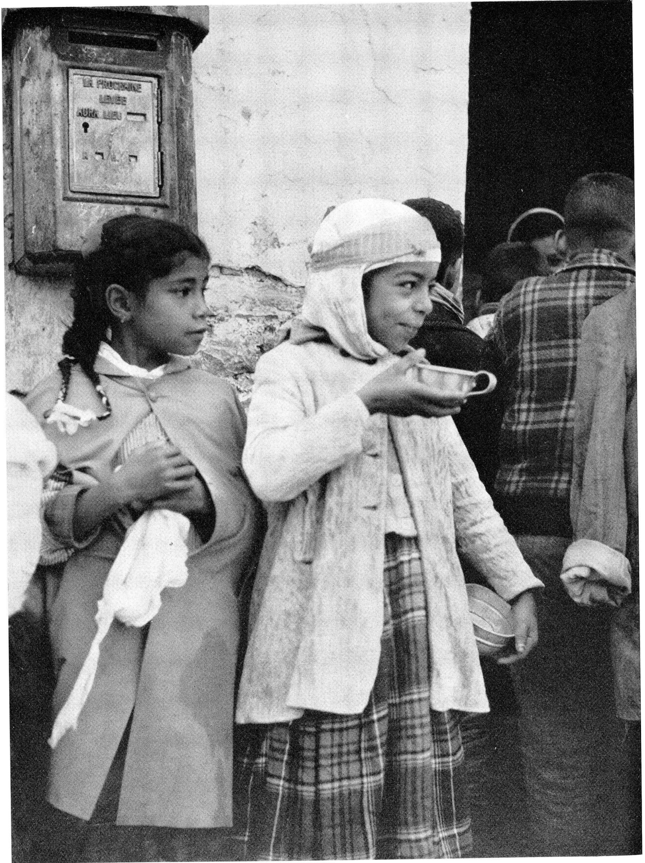
Unser Bild zeigt den Eingang zu einer der sechs «Gouttes de lait», der Milchzentren für Flüchtlingskinder, im grossen Flüchtlingszentrum der Stadt Oujda. In der Provinz Oujda werden vom Marokkanischen Roten Halbmond dreissig solcher Milchküchen geführt.