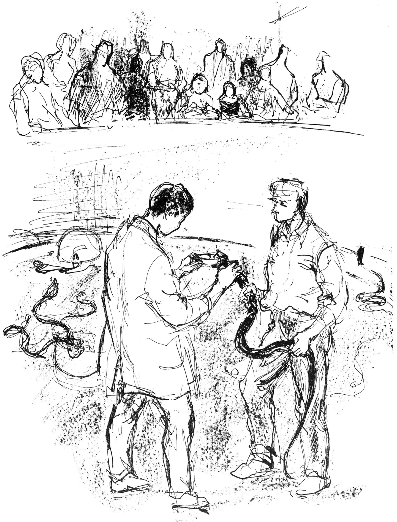
Um eine der mannigfaltigen Arten von Tätigkeiten im Dienste der Volksgesundheit zu zeigen, stellte das Thailändische Rote Kreuz der Ausstellungsorganisation 500 Königskobras, Rajas und Russelvipern, die giftigsten Schlangen seines Landes, zur Verfügung. Die Besucher der Ausstellung konnten zu bestimmten Zeiten den von thailändischen Fachleuten vorgenommenen Giftentnahmen beiwohnen; das Gift dient der Herstellung von Schlangenserum. Zeichnungen Margarete Lipps, Zürich.