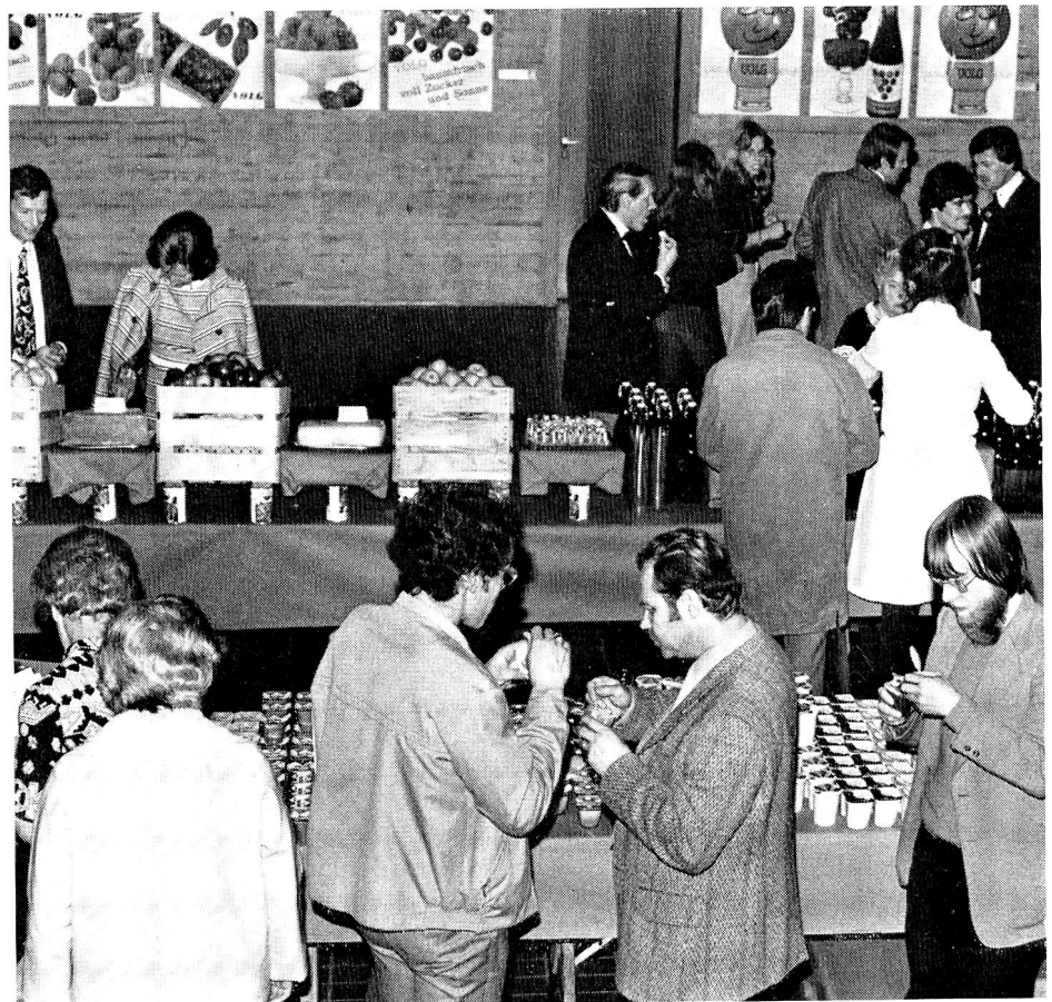
Vorbeugen ist besser als heilen und gesund sein ist schöner als krank sein! Die Aktion «Gesundes Zug» zeigte, wie jeder durch richtige Ernährung und Körpertraining zur Verbesserung und Erhaltung seines Wohlbefindens beitragen kann. Gesundheit ist nicht nur angenehmer, sie ist auch billiger als Krankheit, besonders wenn man sich im Spital pflegen lassen muss. Viele Patienten könnten aber zu Hause bleiben, wenn jemand in der Familie einfache pflegerische Kenntnisse hätte. Deshalb erteilt das SRK entsprechende Kurse an die Bevölkerung.