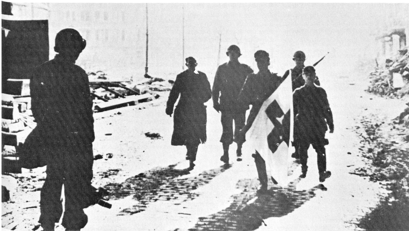
Ein rotes Kreuz auf weissem Grund wurde zum weltweit bekannten Symbol unvoreingenommener Hilfe für Freund und Feind. Die abgebildete Armbinde des Dr. Appia war die erste Anwendung des neuen Schutzzeichens auf einem Kriegsschauplatz (Schleswig-Holstein, 1864).