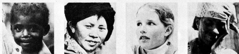
DÍA MUNDIAL DE LA CRUZ ROJA, DE LA MEDIA LUNA ROJA, DEL LEÓN Y SOL ROJOS 1980