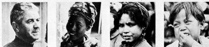
JOURNÉE MONDIALE DE LA CROIX-ROUGE, DU CROISSANT-ROUGE, DU LION-ET-SOLEIL-ROUGE 1980