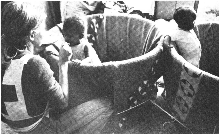
Die Rotkreuzgesellschaft Portugals erbrachte mit vielen Freiwilligen eine enorme Leistung, als massenweise Rückwanderer aus der ehemaligen Kolonie Angola eintrafen.

der nationalen Gesamtplanung verlangt, dass die Behörden und die verschiedenen Freiwilligenorganisationen ihre Arbeit aufeinander abstimmen. Das Rote Kreuz wird sich also vom Ziel leiten lassen, die Freiwilligen an der Entwicklung ihres eigenen Landes zu interessieren und ihnen entsprechende Aufgaben übertragen, die ihren Verantwortungssinn wecken. Die grosse Herausforderung für die Freiwilligenarbeit im Roten Kreuz ist die Notwendigkeit der ständigen, nicht nur sporadischen Hilfstätigkeit. Es geht nicht mehr so sehr um das