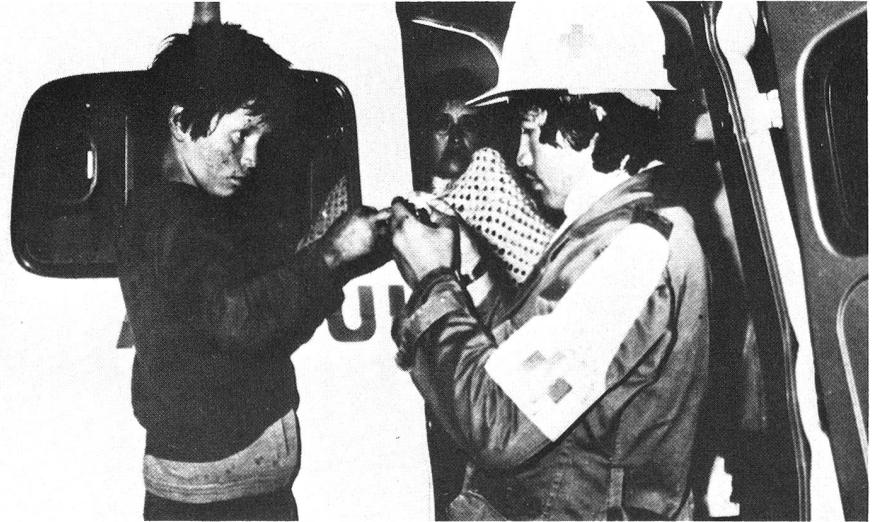
Freiwillige des Kolumbischen Jugendrotkreuzes durchstreifen wöchentlich zweimal nachts gewisse Quartiere Bogotas, um an den Strassenjungen Samariterdienst zu tun.