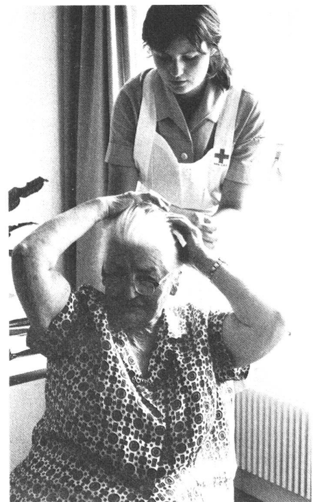
Die Rotkreuzspitalhelferin: besonders in Pflegeheimen eine geschätzte Hilfe.