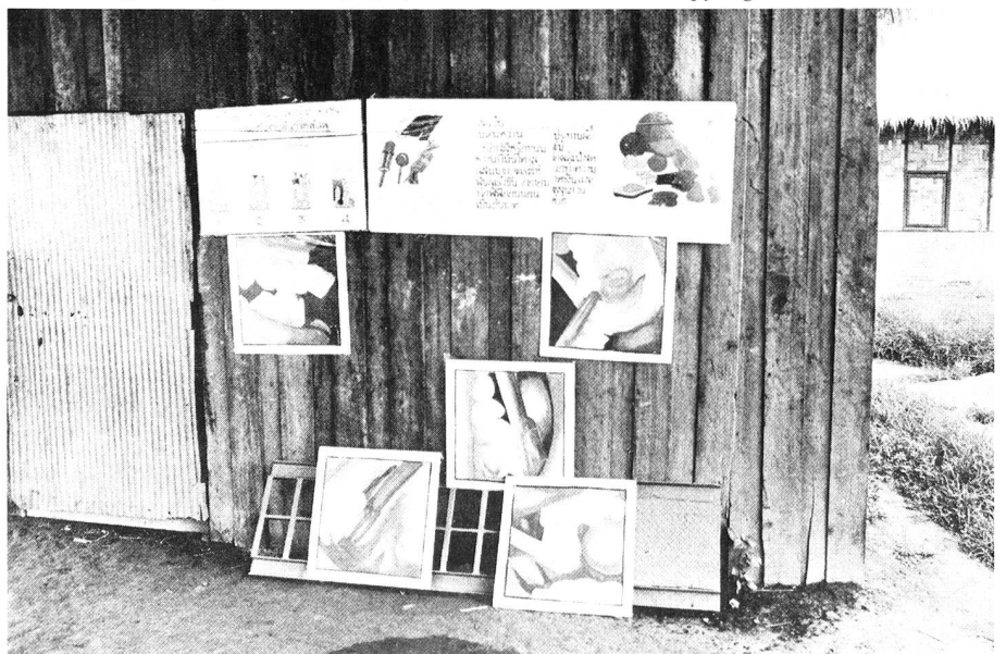
Zahnpflege, wie sie den Flüchtlingen nähergebracht wird.