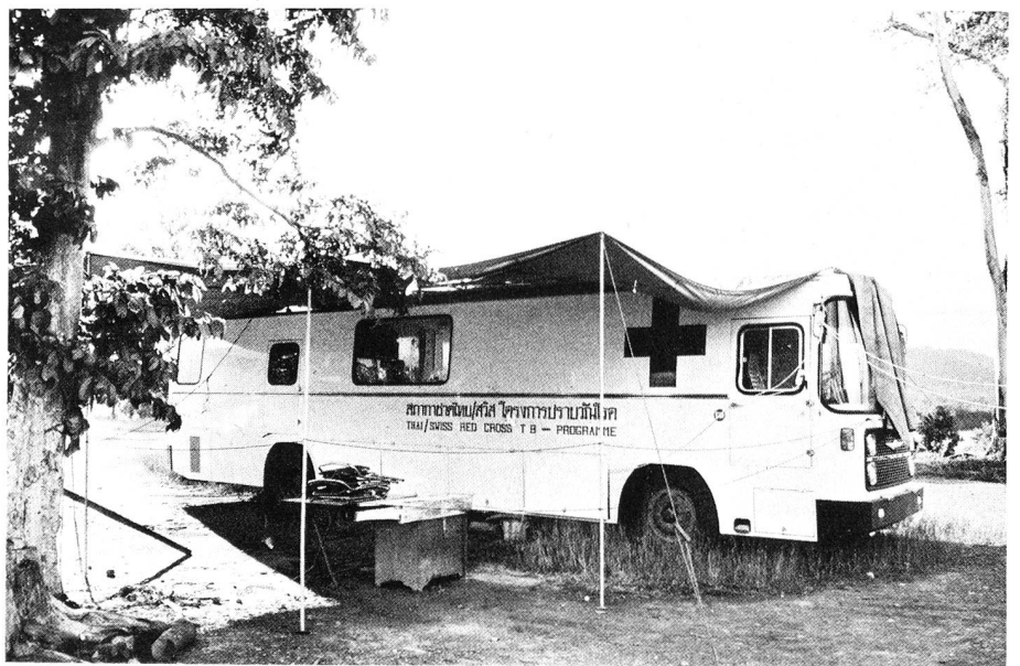
Das Laborfahrzeug unserer Equipe für die Tuberkulosebekämpfung.

Überall, wo Flüchtlinge in grosser Zahl auf engem Raum zusammengedrängt leben, verursacht die Tuberkulose den Hilfsorganisationen Sorgen. Im Spätherbst 1979 nahmen die Fälle offener Tuberkulose in alarmierender Weise zu, und es schien, als breite sich die Krankheit epidemieartig aus. Auf-