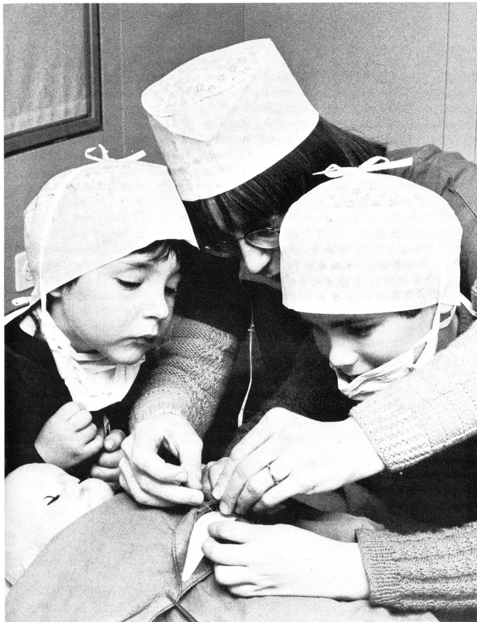
zuschauen und sogar «helfen», als sie zeigte, wie nach der Operation genäht oder wie ein

ihrem Kind vor, während und nach einem Spitalaufenthalt am besten helfen können, das Spitalerlebnis zu verarbeiten.