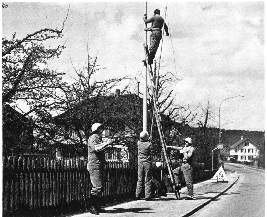
Angehörige des Übermittlungsdienstes (oben) und des Pionier- und Brandschutzdienstes (unten) üben sich in ihre Aufgaben ein.

Der Zivilschutz hat keine Kampfaufgabe, aber so wie von einer zum Widerstand entschlossenen, gut ausgerüsteten und gut geschulten Armee zu erwarten ist, dass sie eine angriffshemmende Wirkung habe, so auch von einem guten Zivilschutz: Durch die Verbesserung der Überlebenschancen der Zivilpersonen und die Stärkung des Durchhaltewillens der ganzen Bevölkerung wird die Aussicht auf Erfolg erpresserischer Drohungen mit Krieg und Vernichtung geringer – der Gegner wird vom Angriff abgehalten. Im Kriegsfall (oder Katastrophenfall) besteht die erste Aufgabe im Schützen der Bevölkerung, was durch die Bereitstellung und den Bezug von Schutzräumen angestrebt wird. Einen absoluten Schutz gegen die Wirkungen von nuklearen, konventio-