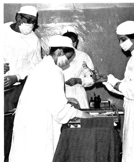
In Übungen und Kursen macht sich die RKD mit der Ausübung der Krankenpflege unter Kriegsbedingungen vertraut.