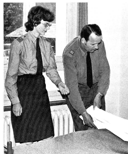
Schon in Friedenszeiten ist die RKD-Schwester unentbehrlich für die Instruktion der Sanitätssoldaten.