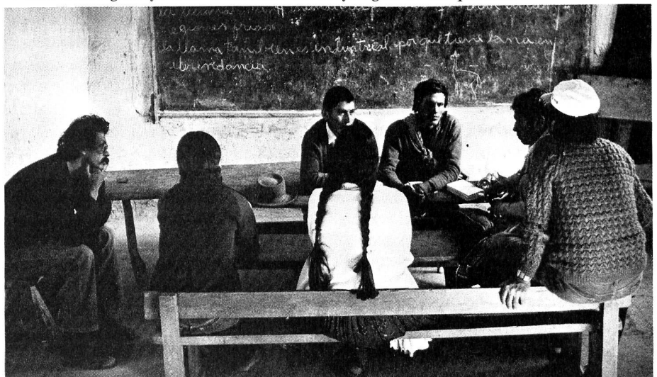
▽ Ausbildung dörflicher Gesundheitsbeauftragter in Chiquerillos.