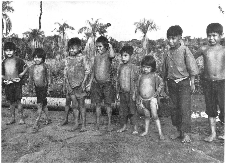
Pai-Tavytera-Kinder sind zur Tuberkulose-Impfung angetreten (Paraguay).