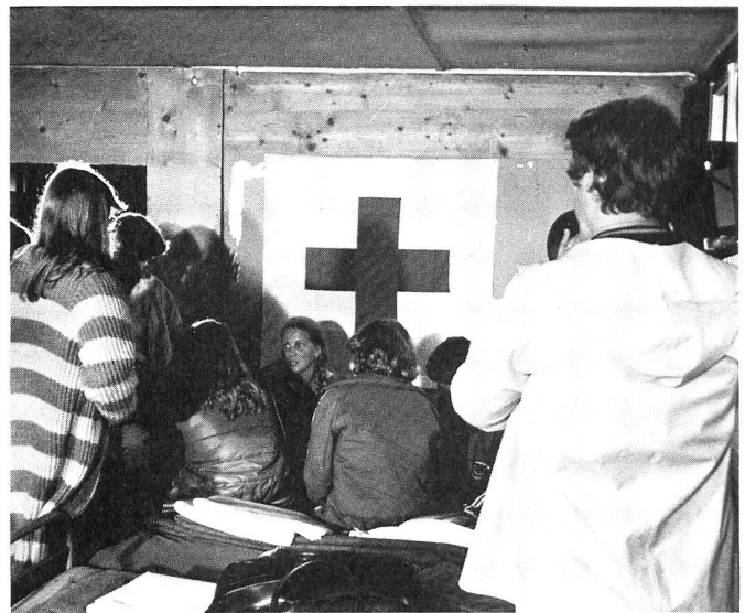
Die ersten Stunden im Lenker Lager im Scheinwerferlicht.