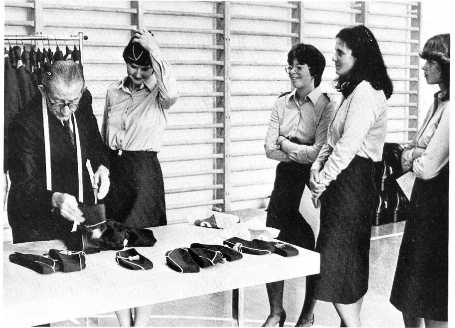
Nach der sanitärischen Untersuchung geht es zur Anprobe der Uniform.