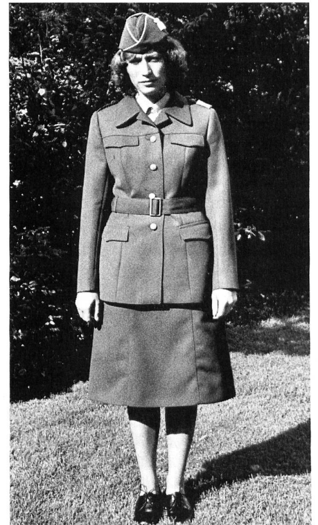
Die neue Rotkreuzdienst-Uniform.