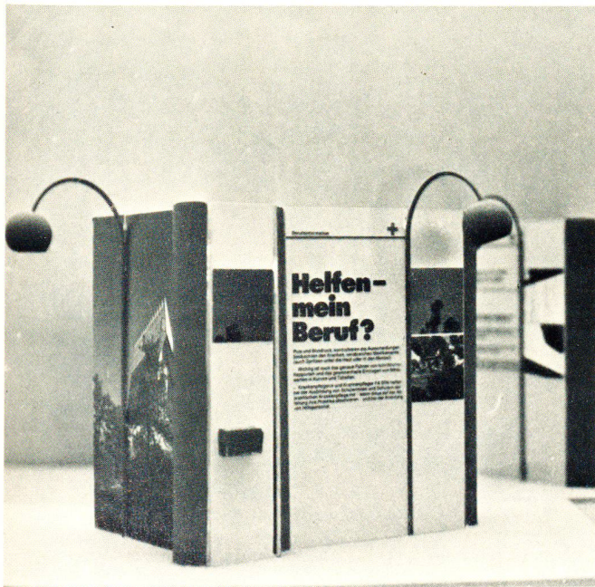
Teil des Modells der 4000 m 2 -Ausstellung.