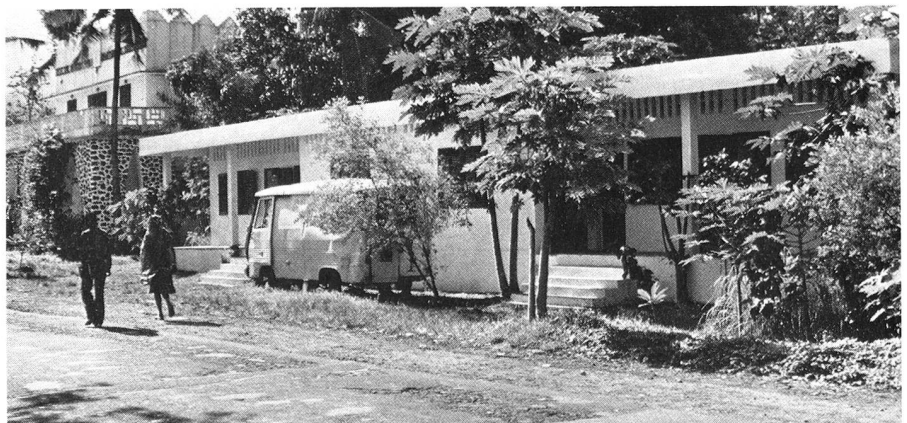
Die zentrale Versorgungsapotheke in Moroni.

Die anlässlich der Weltgesundheitskonferenz von Alma Ata beschlossenen Resolutionen sind auch auf den Komoren beachtet worden, indem die Basismedizin Vorrang erhielt: Impf-