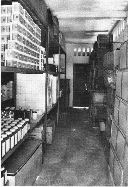
Die Zentralapotheke versorgt alle öffentlichen Spitäler mit den wichtigsten Medikamenten.

Apotheken in Moroni allein jährlich einen Umsatz von über 100 Mio. F CFA ausweist! Die zweite dieser Apotheken dürfte bald einen ähnlich hohen Umsatz erreichen. Demnach besteht also schon auf der Hauptinsel ein Markt von mindestens 200 Mio. F CFA für Medikamente. Die in den öffentlichen Gesundheitszentren behandelten Patienten sollten für abgegebene Medikamente den Selbstkostenpreis entrichten. Mit diesen Mitteln könnte die Staatsapotheke eine regelmässige Versorgung der öffentlichen Gesundheitsdienste mit Basismedikamenten sicherstellen.