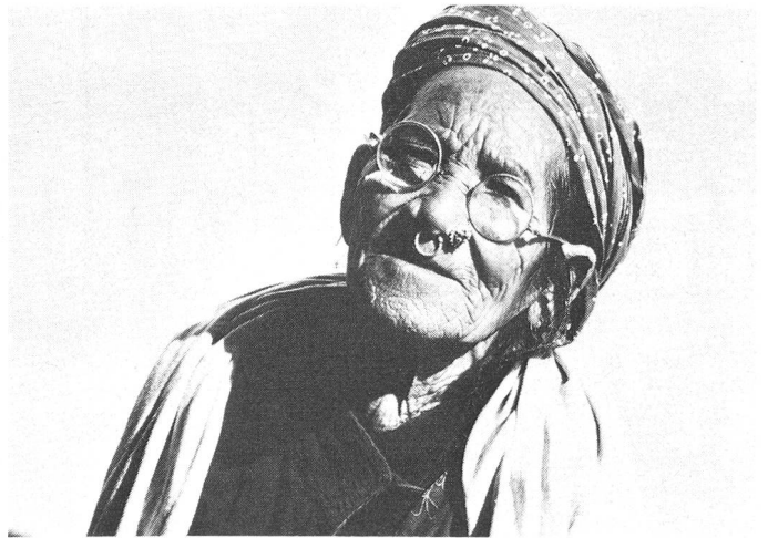
Eine Frau nach Katarakt-Operation, mit neuer Brille. Schätzungsweise 150 000 Personen leiden an Linsentrübung und könnten durch eine verhältnismässig einfache Operation vor völliger Erblindung bewahrt werden.