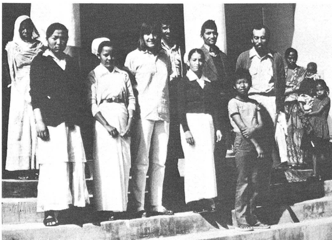
Die im «Augen-Projekt» des SRK engagierte schweizerisch-nepalesische Equipe arbeitet nicht nur in der Klinik, sondern begibt sich auch in entfernte Dörfer, wo Hunderten von Kranken ambulante Behandlung zuteil wird.

Wenn jemand erblindet, so bedeutet dies für den Betroffenen oder für seine Familie keine Stigmatisierung, wie dies zum Beispiel bei Lepra der Fall war und zum Teil heute noch ist. Diese Krankheit wurde als Entgelt für eine schlechte Lebensführung angesehen und der Befallene ausgestossen.