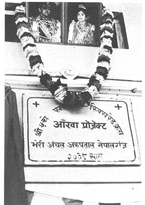
Widmungstafel anlässlich der Einweihung mit den Bildern des Königspaares.