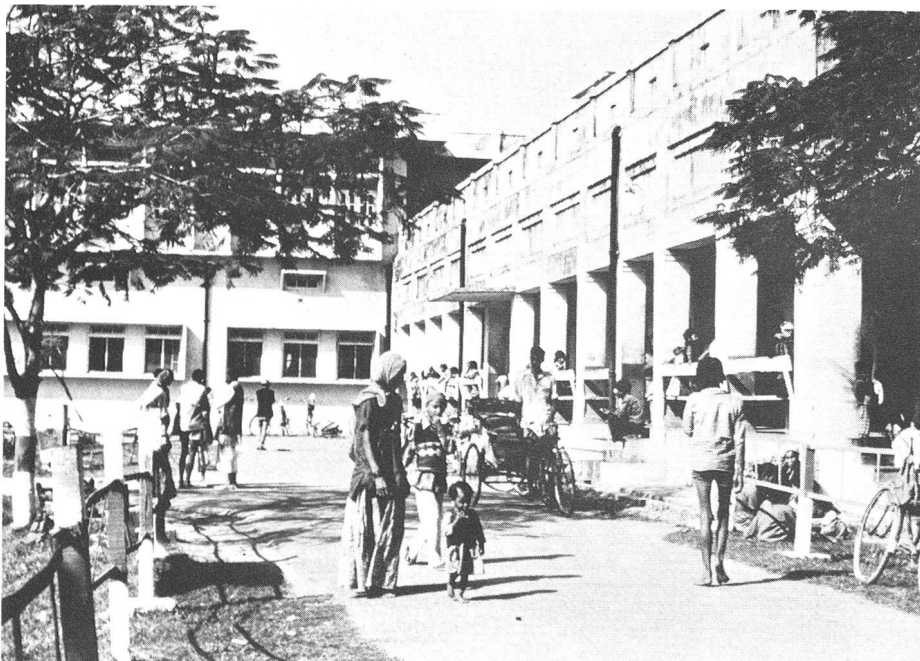
Hauptspital in Nepalganj, an der die Augenklinik eingerichtet wurde, die über 8 Betten verfügt. Daneben wird eine Poliklinik betrieben.