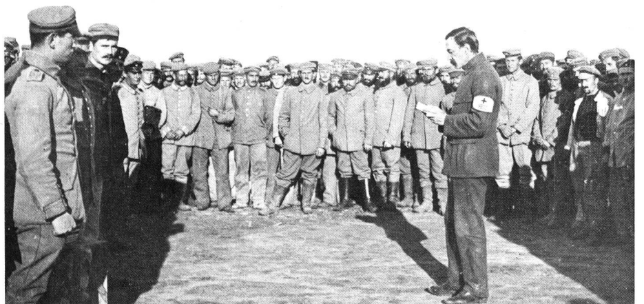
IKRK-Delegierter bei Kriegsgefangenen in Marokko, 1917, als es noch gar keine Konvention zum Schutz der Kriegsgefangenen gab.

Bekanntlich wurde das Rote Kreuz zur Unterstützung der Armeesanität bei kriegerischen Auseinandersetzungen ins Leben gerufen, da sich gezeigt hatte, dass die bisherigen Mittel zur Versorgung der im Felde verwundeten oder der von Epidemien ergriffenen Soldaten nicht ausreichten. Diese