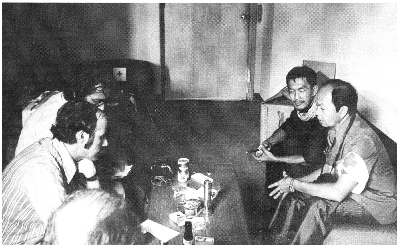
17. April 1975: Erster Kontakt des Chefdelegierten des IKRK mit einem Vertreter der revolutionären Khmer, um humanitäre Hilfeleistungen zu besprechen.