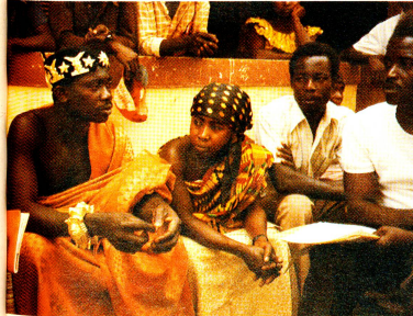
Der Dorfhof von Ananekrom in der Ashanti-Region von Ghana ist die Respektsperson der Dorfgemeinschaft. Auch hier fallen die Bauern durch alle sozialen Netze. Sie sind nicht geschützt.

Auch Ghana ist in den letzten Jahren nicht von katastrophalen Ereignissen verschont geblieben. Man erinnere sich an die Rückwanderung von Hunderttausenden von Ghanern aus Nigeria sowie an die Hungersituation 1982 und 1983. Diese Ereignisse haben das Rote Kreuz veranlasst, ein Katastrophenvorsorgeprogramm im ganzen Land aufzubauen und die regionalen Vertretungen mit Lagermöglichkeiten von Hilfsgütern und mit Transportmitteln auszustatten, was ein schnelles Eingreifen der lokalen Rotkreuzfreiwilligen bei Notssituationen ermöglicht.