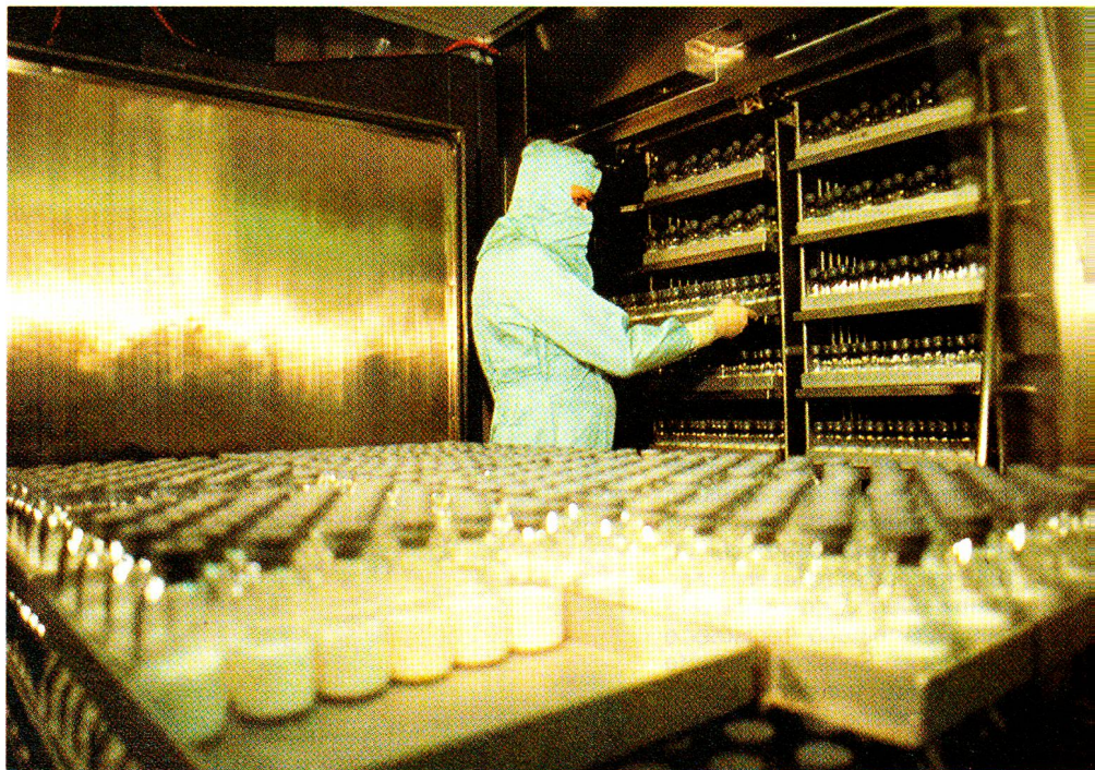
Das Zentrallaboratorium in der Nähe des Wankdorfes in Bern ist rund 500 Angestellten ein sozial fortschrittlicher Arbeitgeber. Als Non-Profit-Organisation wird in erster Linie bei allfälligen Überschüssen in die Forschung investiert.

In neuester Zeit rückt Sandoglobulin sogar bei der Behandlung von AIDS in den Mittelpunkt des Interesses. □