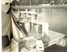
Neben den Zelten, in denen geschlafen wird, steht auch ein primitiver Kleider- und Utensilienschrank.

mosenempfänger werden es möglich, Hilfe zur Selbsthilfe, das ist auch das Motto des Jugendrotkreuzes. □