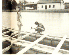
Vor lauter Eifer vergassen einige oftmals sogar das Essen, hier werden die Fässer unter das Floss fixiert.