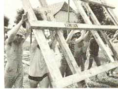
Zusammen aus dem Nichts etwas kreieren, gemeinsam etwas erreichen. Für viele war das ein erstmaliges Aha-Erlebnis.