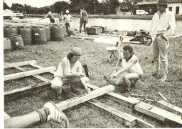
In Belfaux begann das Abenteuer anfangs Juni mit dem Bau von zwei Flossen. Unter erfahrener Leitung wuchsen die Jugendlichen über sich selbst hinaus.

Angehörige sozialer Randgruppen haben grösste Schwierigkeiten, sich in die Arbeitswelt zu integrieren. Durch die verschärfte Lage auf dem Arbeitsmarkt haben Jugendliche mit mangelhafter Ausbildung, mit eingeschränkter Arbeitsfähigkeit, nach einem Aufenthalt im Strafvollzug, in Heimen, in Kliniken, kaum Chancen, Arbeit zu finden. Selbstvertrauen und Selbstständigkeit bleiben bei Jugendlichen Arbeitslosen auf der Strecke. Ohnmacht, Sinn- und Wertlosigkeit verführen sie dazu, sich resigniert total von unserer Gesellschaft abzukehren. Die Floss-Idee ging ursprünglich vom Holzatelier Flüelen aus, einem Projekt für schwervermittelbare Arbeitnehmer. Inzwischen ist daraus ein nationales Projekt geworden. Eine Reihe Jugendorganisationen sind daran beteiligt. Unter anderem auch das Jugendrotkreuz. Die erste Gruppe Jugendlicher startete, unter dem Patronat des JRK am 9. Juni 1986 in Belfaux, mit dem Bau von zwei Flossen und der Bewältigung der ersten Etappe. Im September wird das Jugendrotkreuz noch einmal eine Woche lang dabei sein. Schöner als viele Worte erzählen die Bilder, die uns zugegangen sind, wie positiv dieses Abenteuer auf die Jugendlichen wirkt. Aus Abhängigen und Al-