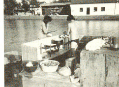
Der Aufbau der einfachen Küche machte besonderen Spass. Alle legten ohne zu Murren Hand an.