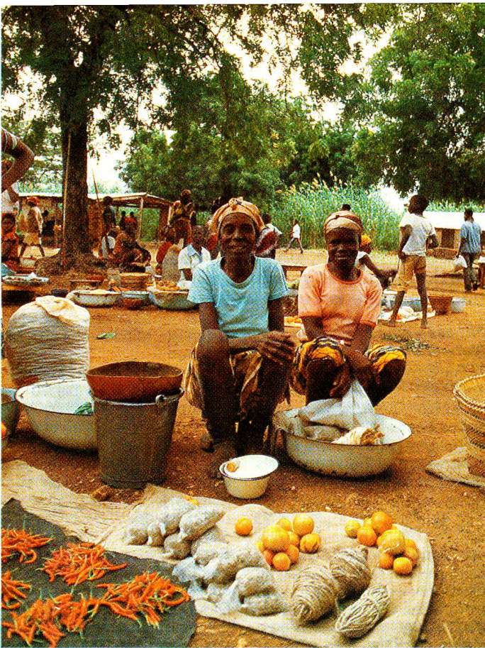
Markt von Zebilla: Als Gemüse werden Tomaten, Okros und roter Pfeffer angeboten.

christlichen Familie; der Vater ist mit drei Frauen verheiratet. (Diese Tatsache mag erstaunen, doch alte afrikanische Traditionen sind in ganz Ghana mit christlichem Gedankengut vermischt.)