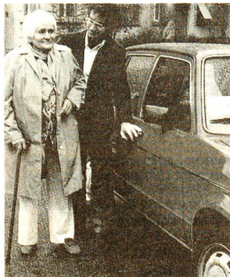
Autodienst (1 500 000 km wurden 1985 freiwillig im Dienst des Mitmenschen gefahren).