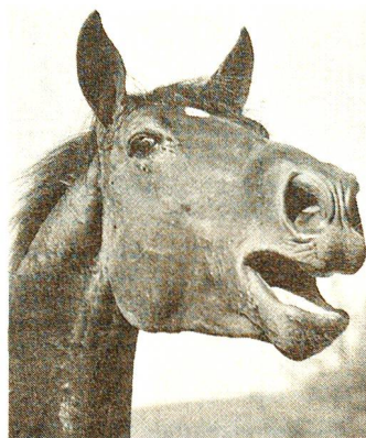
Die Hengste im Haras fédéral haben legendäre Stammbäume.