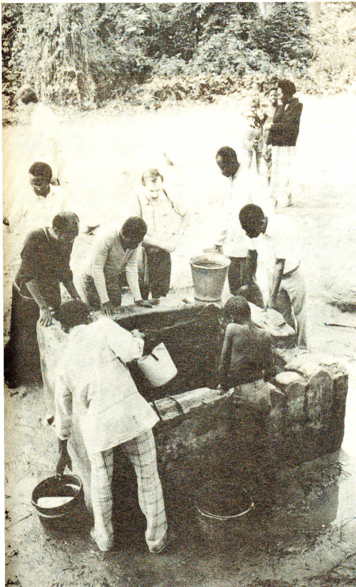
Ghana Ghana Red Cross in Aktion.

1986 war ein bewegtes Jahr. Doch bevor es zu Ende geht, möchten wir Ihnen von Herzen frohe Festtage wünschen. Ihr Vertrauen ist für uns das kostbarste Geschenk.