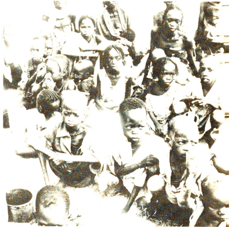
Tschad In der Präfektur Biltine soll ein angemessener Basisgesundheitsdienst aufgebaut werden. Das SRK engagiert sich langfristig und setzt eine aktive Beteiligung der einheimischen Kräfte voraus.

Eine vom SRK im April 1985 durchgeführte Evaluation in den Hungergebieten im Tschad hat die Vermutung bestätigt, dass die Aktionen unserer Dachorganisation Fehler und Mängel in Planung, Konzeption und Durchführung aufweisen. Das SRK hat in der Folge vermehrt eigene Programme durchgeführt.