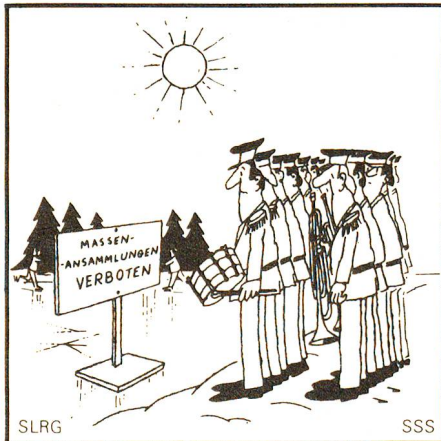
Bei Rissbildung, verursacht durch Tauwettereinbruch, sind Massenansammlungen zu vermeiden.