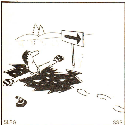
Du brichst im Eis ein! – Breite sofort die Arme aus und versuche in der gleichen Richtung, aus welcher Du gekommen bist, hinauszusteigen.