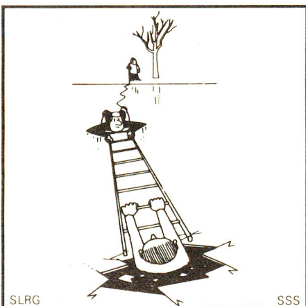
Da bricht jemand im Eis ein! – Alarmiere sofort weitere Helfer und nähere Dich dann in Bauchlage mit einem Rettungsgerät dem Eingebrochenen.