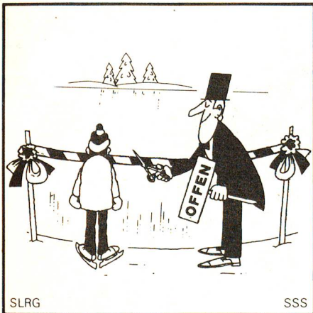
Betrete nur Eisflächen, welche von der Behörde freigegeben worden sind.

Unfälle sind vermeidbar. Wie, darüber klärt hier die Schweizerische Lebensrettungs-Gesellschaft – Korporativmitglied des SRK – auf.