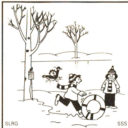
Rettungsgeräte, d. h. Leitern, Stangen, Ringe, Bälle, Leinen usw., sind keine Spielzeuge.