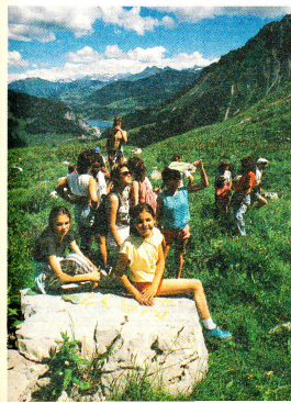
Unterwegs zu den Rochers-de-Naye.