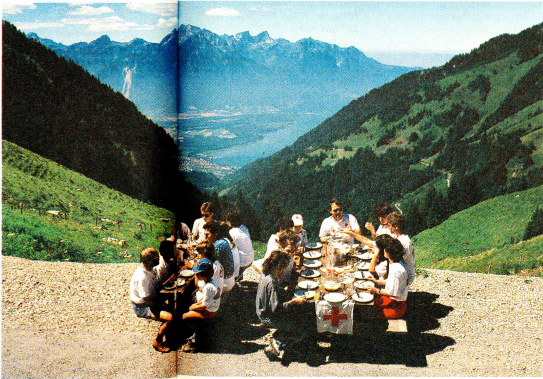
Ungezwohene Atmosphäre während des Mittagessens vor der Refex-Hütte am Fusse der Rochers-de-Naye.