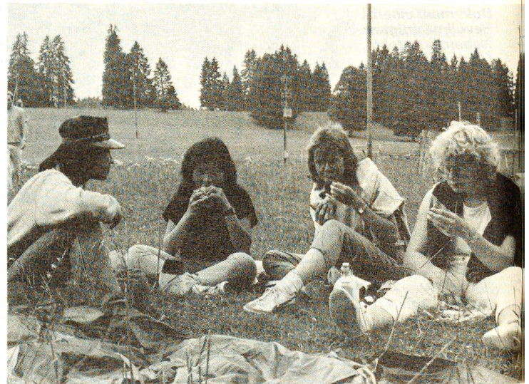
Gemeinsam müde und hungrig: auch das eine integrierende Erfahrung.

Was vorauszusehen war, trat auch ein: Die Zeit verging viel zu schnell. So war er dann plötzlich da, der Abschied. Doch es war ein anderes Händedrückchen als beim ersten Kennenlernen. Für einige der Schweizer Lagerteilnehmer war es das erstemal, dass sie bewusst auf einen Menschen eines fremden Kulturkreises zugegangen waren, ihn kennenlernen durften. Manches Vorurteil, konnte abgebaut werden. Flüchtlinge durften die Erfahrung machen, dass sie als Mitmenschen akzeptiert wurden, dass sie sich nicht minderwertig vorkommen mussten. Die Erfahrung,