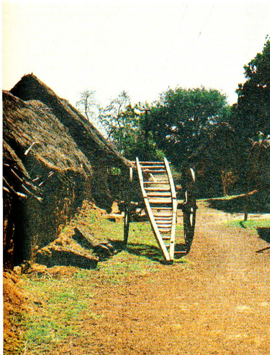
Der Handwagen steht unbenutzt: kein Regen bedeutet für die Tagelöhner keine Arbeit.