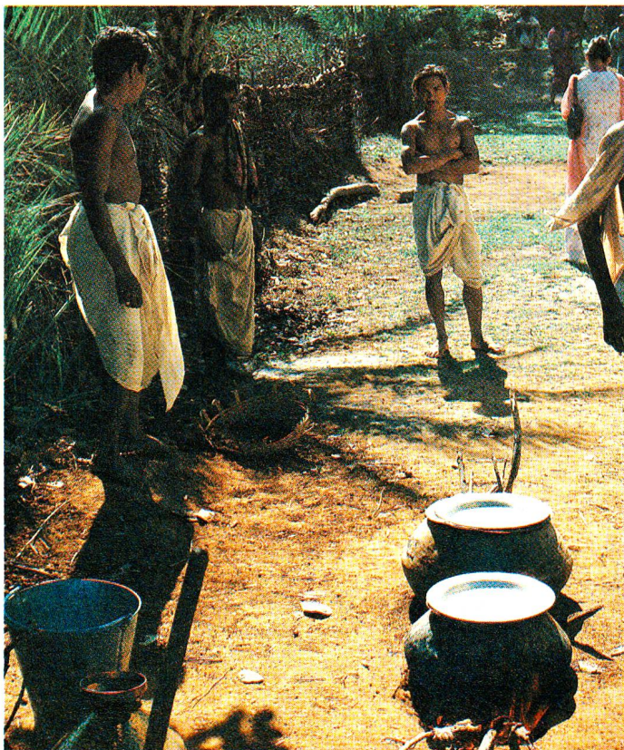
Das Essen wird auf einfachen Feuerstellen zubereitet.

Mit diesem Projekt, das Anfang des kommenden Jahres in die aktive Planungsphase tritt, etwa vier Jahre dauern und Kosten in der Höhe von rund 600 000 Franken verursachen wird, entwickelt sich die Katastrophenhilfe von der Hilfe zum unmittelbaren Überleben zu einer Hilfe, die Katastrophen wenn nicht verhindern, so doch in ihren Auswirkungen stark lindern kann. Der enge Kontakt, den es den Rotkreuzmitarbeitern zur armen