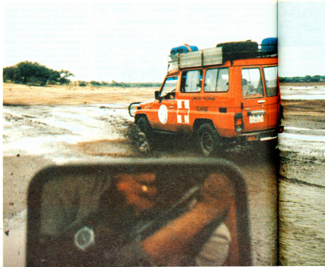
Fahrt unter härtesten Bedingungen. Nur sorgfältig vorbereitete Fahrzeuge halten solchen Anforderungen stand.

Ein Walliser Autosportverein hat dem SRK zwei Geländefahrzeuge geschenkt. Mitglieder des Vereins brachten sie im vergangenen August in den Tschad, ihr künftiges Einsatzgebiet.