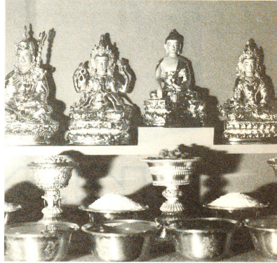
In fast jedem Tibeter Haushalt steht ein Hausaltar. In der Mitte ein Buddha, links und rechts davon Göttinnen der Weisheit, der Barmherzigkeit, des langen Lebens usw. Vorne Opferschalen mit Getreide und klarem Wasser.

Wie lange werden die Tibeter Flüchtlinge die alten Familien-traditionen im Ausland bewahren können? Der kleine Tenzin Dhamdün wird eines Tages die Schweizer Schulen besuchen und mit den andern Kindern zürchdeutsche sprechen. Wird er je ganz verstehen, welche religiösen Kunstwerke sein Vater in der Freizeit schafft und welche uralte mystische Bedeutung sie haben? □