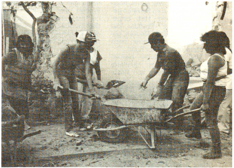
Ein Fachmann zeigt, wie's gemacht wird. Die Frauen packen kräftig an.

Auch die Vereinigung «Campanamentos Unidos AC», mit der das SRK eng zusammenarbeitet, hat eine Finanzkommission (Fortsetzung Seite 22)