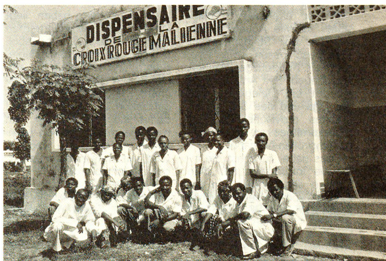
Das Rotkreuz-Quartierdispensarium in der malischen Hauptstadt Bamako. Seine Mitarbeiter hielten den Betrieb auch in schwierigen Zeiten und mit bescheidensten Mitteln aufrecht.

Nur in der Hauptstadt Bamako konnte die nationale Rotkreuzgesellschaft mit bescheidensten Mitteln ihren Verpflichtungen nachkommen. Hier wurden mit Sorgfalt ein Quartierdispensarium betrieben und gleichzeitig zivile und militärische Nothelfer ausgebildet. Dank diesem Minimum an Aktivitäten hat die Gesellschaft ihre Existenz behaupten können. Nun geht es darum, an die Fähigkeiten und Möglichkeiten Malis, eine Rotkreuzgesellschaft zu tragen, anzuknüpfen.