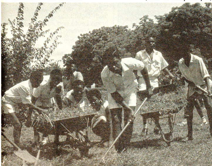
Eine ghanaische Jugendrotkreuzgruppe säubert ein Spitalgelände. Die Jugendgruppen gehören zu den aktivsten Mitgliedern des Ghanaischen Roten Kreuzes.

An vielen anderen Ecken Ghanas kann man immer wieder ähnliche «Dorfereignisse» beobachten: Das Rote Kreuz von Ghana spielt eine wichtige Rolle bei der Promotion der Gesundheitsvorsorge. Solche Begegnungen bringen für viele Menschen immer wieder verstärkte Gefühle der Verbundenheit und der Sicherheit sowie Zukunftshoffnung und damit auch neue Kräfte für die Lebensbewältigung. □