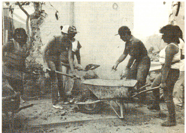
Ein Fachmann zeigt, wie's gemacht wird. Die Frauen packen kräftig an.

Auch die Vereinigung «Campaneros Unidos AC», mit der das SRK eng zusammenarbeitet, hat eine Finanzkommission. (Fortsetzung Seite 22)