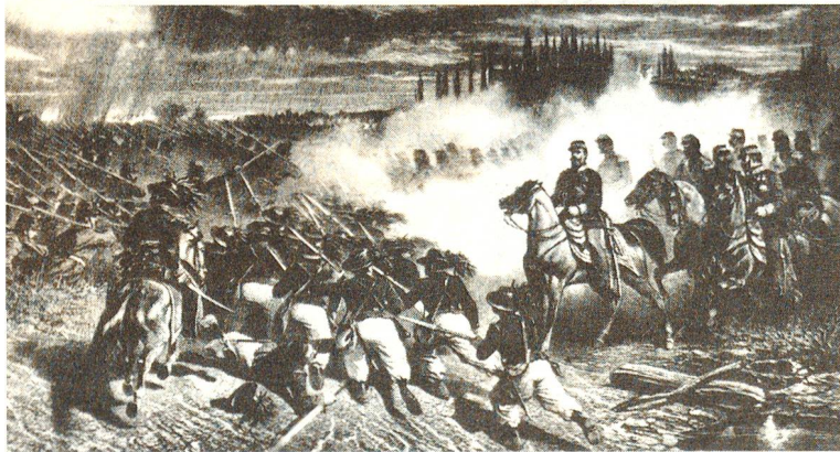
Solferino, 24. Juni 1859: 170 000 Franzosen und 150 000 Österreicher stiessen hier in einer blutigen Schlacht zusammen. Am Abend blieben auf dem Schlachtfeld 40 000 Tote und Verwundete zurück. Der Sanitätsdienst der siegreichen Franzosen war hoffnungslos überfordert, und die verletzten Soldaten mussten unter primitivsten Bedingungen ums Überleben kämpfen.

125 Jahre sind eine lange Zeit, in der die Welt unglaubliche Veränderungen durchgemacht hat. Die Rotkreuzidee hat mit der Entwicklung Schritt gehalten und ist heute aktueller denn je.