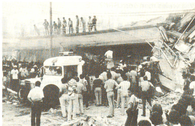
Oktober 1986: Nach dem schweren Erdbeben in San Salvador suchen Rettungsmannschaften des Salvadorianischen Roten Kreuzes in den Trümmern nach Überlebenden. In seiner «Erinnerung an Solferino» sah Henry Dunant bereits vor, dass die Hilfsgesellschaften «bei Epidemien oder Naturkatastrophen ... grosse Dienste leisten» können. Für die Hilfe in Friedenszeiten sind heute die Liga der Rotkreuz- und Rothalbmondgesellschaften und die in ihr zusammengeschlossenen nationalen Gesellschaften zuständig.