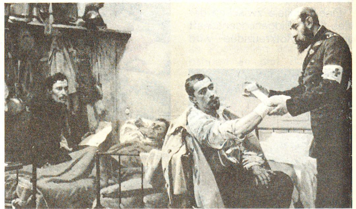
In ganz Europa entstanden nach 1863 Hilfsgesellschaften für die Verwundetenpflege. In der Schweiz wurde 1866 der «Hilfsverein für schweizerische Wehrmänner und deren Familien» gegründet, der sich während des deutsch-französischen Krieges von 1870-1871 der bei Les Verrières über die Schweizer Grenze strömenden Bourbaki-Armee annahm.

fc. Vor 125 Jahren gründete Henry Dunant zusammen mit vier andern Genfern die Internationale Rotkreuzbewegung, die heute das Internationale Komitee vom Roten Kreuz (IKRK), die Liga der Rotkreuz- und Rothalbmondgesellschaften sowie die in ihr zusammengeschlossenen 145 nationalen Gesellschaften, darunter das Schweizerische Rote Kreuz, umfasst.