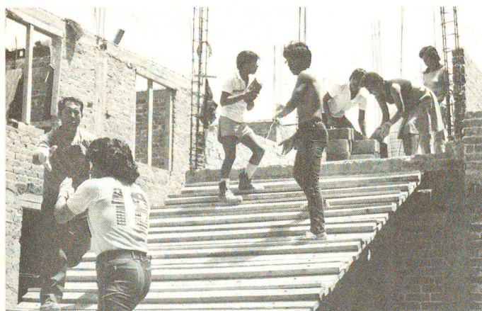
Die nationalen Rotkreuzgesellschaften erfüllen neben der Nothilfe eine Vielzahl von anderen Aufgaben. So betreut das Schweizerische Rote Kreuz in zahlreichen Ländern Aufbau- und Entwicklungsprojekte, mit denen es die Lebenssituation der betroffenen Bevölkerung dauerhaft verbessern möchte.