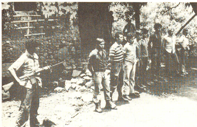
Kriege, Kampftechniken und Waffen haben sich seit Abschluss des ersten Genfer Abkommens verändert. Das humanitäre Völkerrecht trägt dieser Entwicklung Rechnung. Heute schützen vier Genfer Abkommen und zwei Zusatzprotokolle alle militärischen und zivilen Opfer internationaler und nicht-internationaler Konflikte.