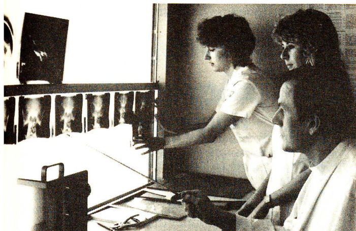
Nach dem Röntgen werden die Aufnahmen jeweils an eine Leuchtwand gehängt, damit sie vom Arzt befundet werden können. Die Medizinisch-technische Radiologieassistentin arbeitet eng mit dem Arzt zusammen. Teamarbeit wird bei dieser Arbeit grossgeschrieben.

hat auch beobachtet, dass atmosphärische Schwankungen oder Vollmond Einfluss auf Patienten, Personal und auch auf die Häufigkeit von Verkehrsunfällen haben. Einflüsse, die sich mit der ausgeklügelten Technik nicht ausschalten lassen. Sie findet es wichtig, dass man sich bewusst ist, dass die Technik oft hilfreich eingesetzt werden kann aber nie dominieren darf.