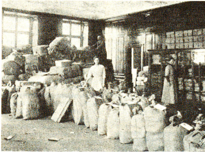
Im Zentraldepot: die tägliche Spedition ist versandbereit.

Zur Aufnahme der Naturalspenden richteten die SRK-Sektionen und die Samaritervereine regionale Sammelstellen ein. Später mussten angesichts des grossen Spendenzuflusses in St.Gallen, Zürich, Luzern, Lausanne und Bern fünf grosse Zentraldepots eröffnet werden. Ab März 1916 bis zum Ende der Mobilisation blieb dann allerdings nur noch das direkt dem Rotkreuz-Chefamt unterstellte Berner Depot in Betrieb. Erwähnenswert ist in diesem Zusammenhang die Tatsache, dass die Eidgenössische Postdirektion für die meisten Sammelplakate Portofreiheit gewährte, was wesentlich zum Erfolg der Kollekte beitrug.