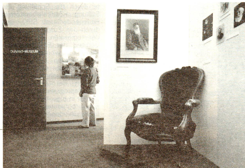
Der Lehnstuhl Henry Dunants im Dunant-Museum im alten Bezirksspital von Heiden.