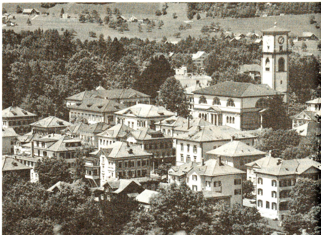
Hier in Heiden im Kanton Appenzell Ausserrhoden verbrachte Henry Dunant die letzten 23 Jahre seines Lebens.