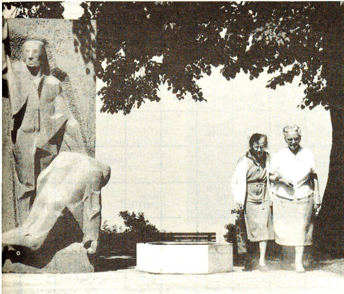
Nur wenige Minuten vom Museum entfernt: das Denkmal Henry Dunants.