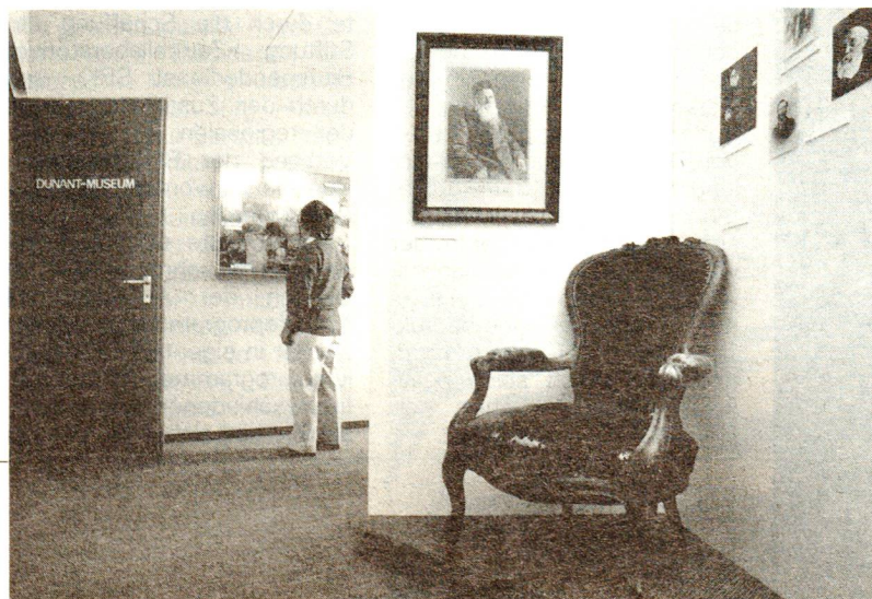
Der Lehnstuhl Henry Dunants im Dunant-Museum im alten Bezirksspital von Heiden.