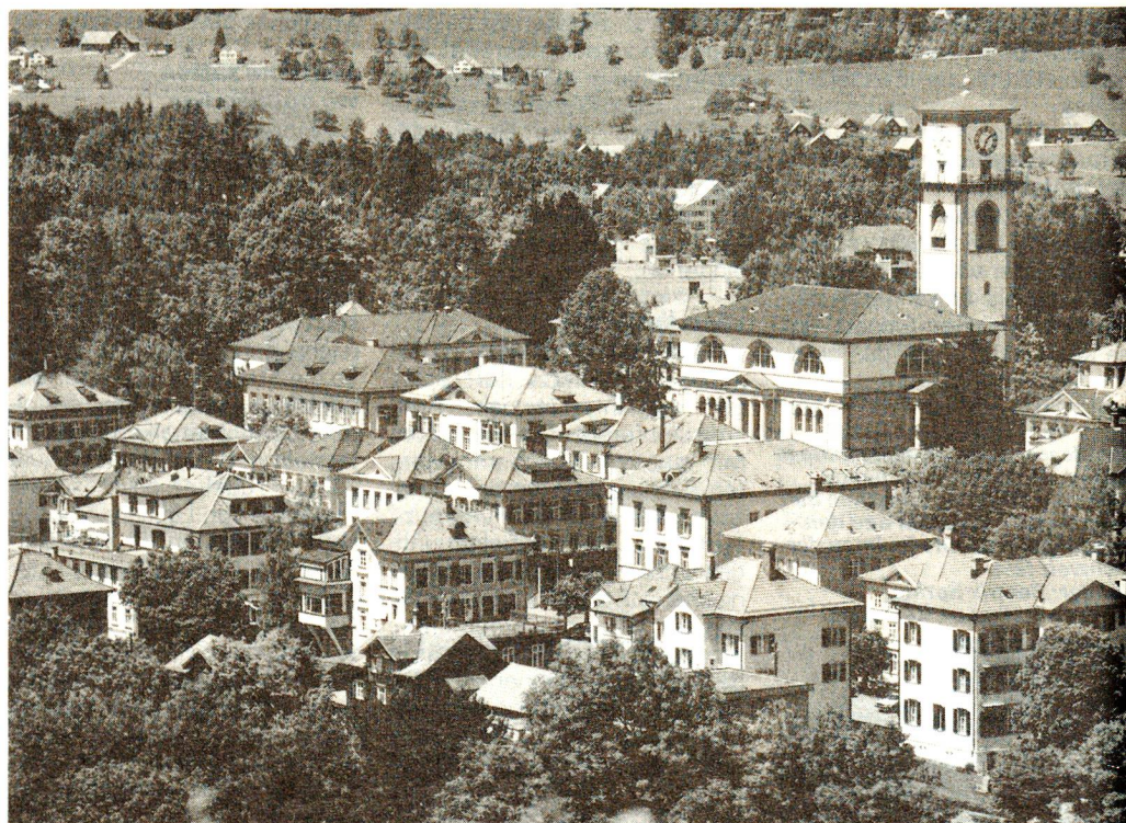
Hier in Heiden im Kanton Appenzell Ausserrhoden verbrachte Henry Dunant die letzten 23 Jahre seines Lebens.