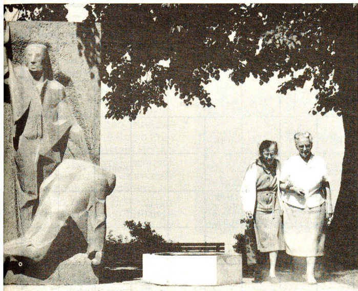
Nur wenige Minuten vom Museum entfernt: das Denkmal Henry Dunants.