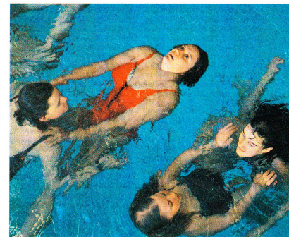
Eine Einführung in das Rettungsschwimmen stand ebenfalls auf dem Programm.

Nach der Arbeit das Vergnügen: die Jugendrotkreuzgruppe aus Spanien am Unterhaltungsabend.