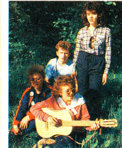
In der Schweiz dank «Glasnost»: vier Mitglieder der sowjetischen Jugendrotkreuz-Delegation.