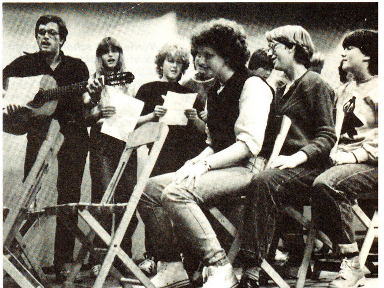
Lenk 1982. Im Lager wird auch die Freizeit zusammen gestaltet und verbracht.