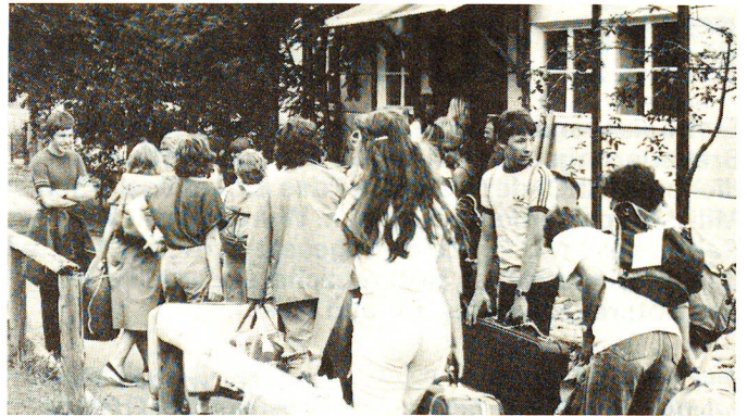
Lenk 1982. Ankunft vor den Lenker Militärbaracken. Während 17 Jahren wurden in Lenk Schnupperlehr-Lager durchgeführt.

ist.» Im Westschweizer Lager machten immer wieder auch Tessiner Jugendliche mit. Jetzt benötigen sie für eine Teilnahme Deutschkenntnisse.