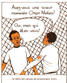
Die «Familie Tenga». Diese Bildgeschichte hat in zahlreichen englisch- und französischsprachigen Ländern Afrikas dazu beigetragen, den Rotkreuzgedanken bekanntzumachen.

und fand auch in den französischen und portugiesischsprachigen Ländern Afrikas weite Verbreitung. Bis heute sind schätzungsweise über eine Million Exemplare in fast allen Teilen des afrikanischen Kontinents verteilt worden – über genaue Zahlen verfügt man allerdings nicht. 1987 übernahm – mit einer Anpassung der Zeichnungen und Szenarien – auch Haiti die «Familie Tenga».