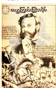
So sehen die Burmesen Henry Dunant. Leben und Werk des Rotkreuzgründers inspiriert Comic-Autoren überall auf der Welt immer wieder aufs Neue.

Auch die nationalen Gesellschaften verwenden häufig Comics als Werbeträger. Das Rote Kreuz in Belgien zum Beispiel, dem Comic-Land par excellence, verwendete Tim (= Tintin) und Käpt'n Haddock für seine Finanzierungsaufforderungen. Die Blutspendendienste der nationalen Rotkreuzgesellschaften benutzen Comic-Figuren zur Spenderwerbung insbesondere beim jugendlichen Publikum. Bevorzugtes Thema der Rotkreuz-Comic-Schöpfer aller Kontinente ist jedoch nach wie vor die Geschichte der Bewegung und das Leben Henry Dunants, auch wenn Bewunderer des grossen Mannes ob gewisser zeichnerischer Kühnheiten manchmal vor Schreck erbleichen. □