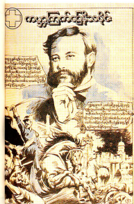
So sehen die Burmesen Henry Dunant. Leben und Werk des Rotkreuzgründers inspiriert Comic-Autoren überall auf der Welt immer wieder aufs Neue.

Auch die nationalen Gesellschaften verwenden häufig Comics als Werbeträger. Das Rote Kreuz in Belgien zum Beispiel, dem Comic-Land par excellence, verwendete Tim (= Tintin) und Käpt'n Haddock für seine Finanzierungsaufträge. Die Blutspendendienste der nationalen Rotkreuzgesellschaften benutzen Comic-Figuren zur Spenderwerbung insbesondere beim jugendlichen Publikum. Bevorzugtes Thema der Rotkreuz-Comic-Schöpfer aller Kontinente ist jedoch nach wie vor die Geschichte der Bewegung und das Leben Henry Dunants, auch wenn Bewunderer des grossen Mannes ob gewisser zeichnerischer Kühnheiten manchmal vor Schreck erbleichen.