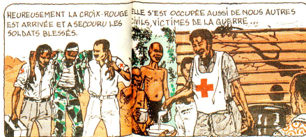
Mit diesen Bildgeschichten erklärt die nationale Rotkreuzgesellschaft der Volksrepublik Kongo ihren Mitgliedern das Rote Kreuz.