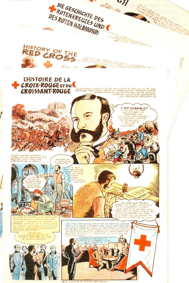
HISTORY OF THE RED CROSS

Diesen ebenfalls vom IKRK herausgegebenen Comic über die Geschichte des Roten Kreuzes und des Roten Halbmonds gibt es auch in seltenen Sprachen wie das in Äthiopien gesprochene Amharisch.