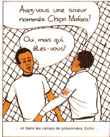
Die «Familie Tenga». Diese Bildgeschichte hat in zahlreichen englisch- und französischsprachigen Ländern Afrikas dazu beigetragen, den Rotkreuzgedanken bekanntzumachen.

und fand auch in den französischen und portugiesischsprachigen Ländern Afrikas weite Verbreitung. Bis heute sind schätzungsweise über eine Million Exemplare in fast allen Teilen des afrikanischen Kontinents verteilt worden – über genaue Zahlen verfügt man allerdings nicht. 1987 übernahm – mit einer Anpassung der Zeichnungen und Szenarien – auch Haiti die «Familie Tenga».