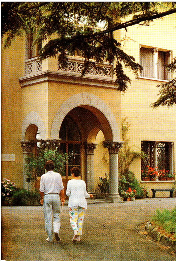
Herrschaftshaus in einem prächtigen Park: die «Casa Henry Dunant» in Varazze.

Fassade 1980 und 1981 unterzogen wurde. Die Arbeiten wurden vom Schweizerischen Roten Kreuz und der Stiftung gemeinsam finanziert.