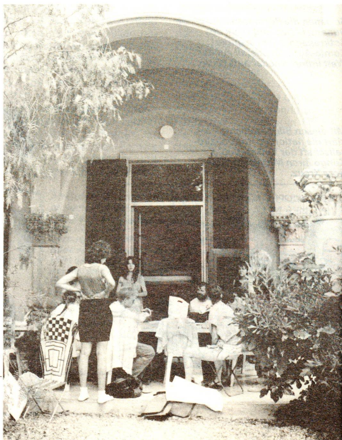
Seminaristen aus Basel. Die «Casa Henry Dunant» ist ein idealer Ort für Studienaufenthalte und Seminare.