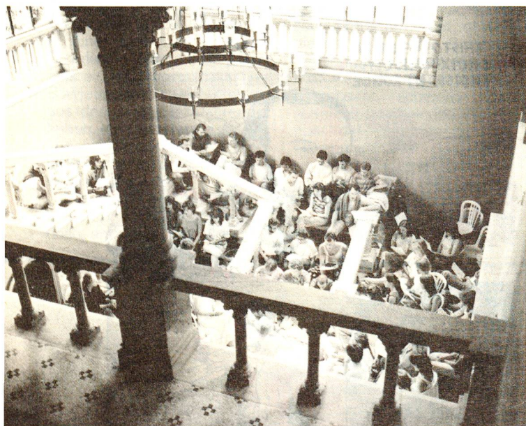
Die Eingangshalle mit Treppe. Im Zweiten Weltkrieg diente sie als Stall.

zu jener Zeit die Kinderhilfe des Schweizerischen Roten Kreuzes eine Bleibe für etwa fünfzig italienische Waisen und deren Erzieherinnen und Erzieher suchte. «Wir mussten rasch