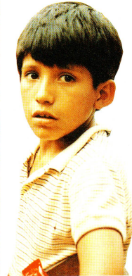
Situation, die viele Familien zwingt, die Kinder zur Arbeit zu schicken, wenn die Familie überleben soll, will sie die Strassenkinder vielmehr in ihrem täglichen Leben begleiten und sie besser für ihren Überlebenskampf wappnen. Sie möchte ihnen – und auch ihren Familien – aber auch bewusst machen, weshalb sie ein solches Leben führen müssen, damit sie später vielleicht in der Lage sind, an ihrem Schicksal etwas zu ändern.