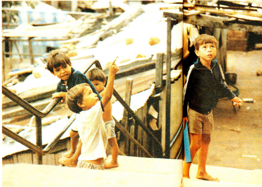
Unsere Bilder wurden von der schwedischen Filmerin Marianne Ahlne in den Strassen von Asunción aufgenommen. Sie sprechen für sich. Wir verzichten deshalb für einmal auf die Legenden.

Der Begriff «Calleescuelas» setzt sich aus calle = Strasse und escuela = Schule zusammen, bedeutet also soviel wie Schule auf der Strasse oder Strassenschule. Die im vergangenen Jahr gegründete Institution will die Kinder nicht von der Strasse holen, Angesichts einer wirtschaftlichen